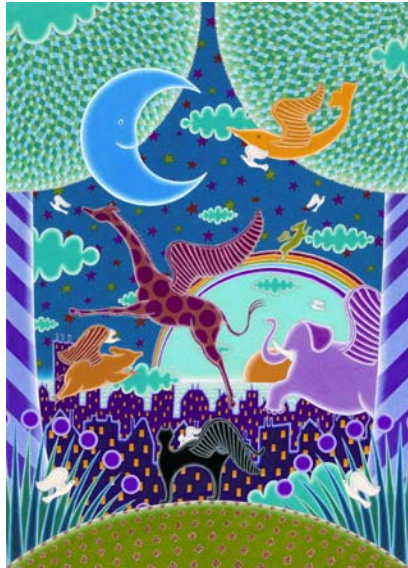
Wolfgang Nocke: Grenzenlos © DHL

Die Sicherheitsbestimmungen für den Zutritt zum Post Tower machen es erforderlich, einen Personalausweis/Reisepass bereit zu halten.