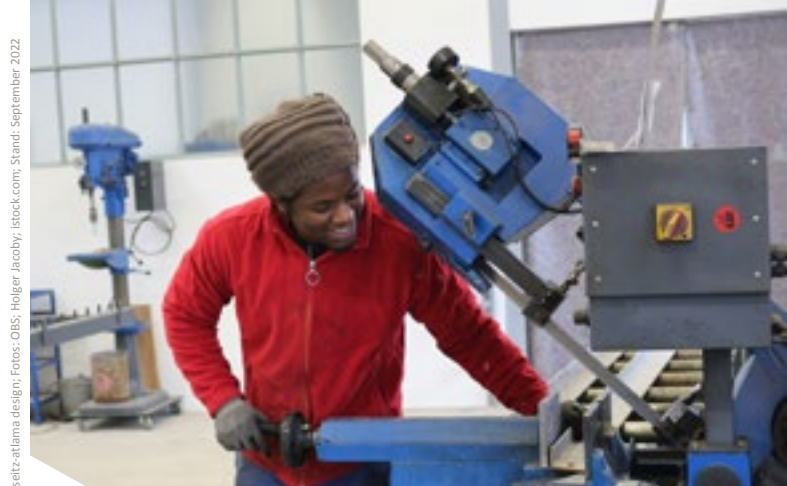
Design: seitz-atama design; Stand: September 2022

Seit mehr als 55 Jahren arbeiten wir in den Bereichen Integration und Qualifikation. Unsere Schwerpunkte sind Ausbildung und Studium, Arbeitsmarkt sowie Jugend- und Elternarbeit. Wir entwickeln Integrations- und Qualifizierungsangebote, die wir mit unseren Kooperationspartnern durchführen. Wir sind ein gemeinnütziger Verein mit Sitz in Bonn; parteipolitisch und weltanschaulich neutral. Unsere Kooperationspartner sind Bundes- und Länderministerien, Kommunen, Behörden, Universitäten, Unternehmen und Verbände.